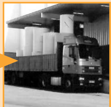
Acabats i embalatge