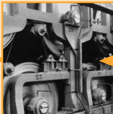
Formació del full i premsatge